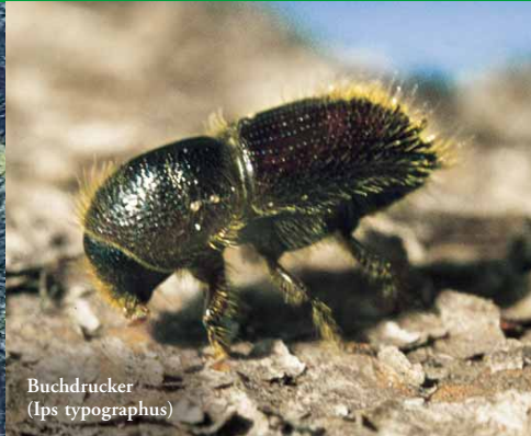
Buchdrucker (Ips typographus)