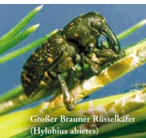
Großer Brauner Rüsselkäfer (Hylobius abietes)